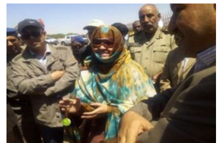
La ministre du développement rural visite le projet

Sur place, la ministre a pris connaissance de la production de la ferme en Gombo vert destinée à l'exportation vers les marchés internationaux et suivi des exposés sur les particularités du projet, qui connaît actuellement une saison de récolte de cinq mois et couvre une superficie de 50 hectares. Il est irrigué à partir des eaux de l'Aftout Essahli.